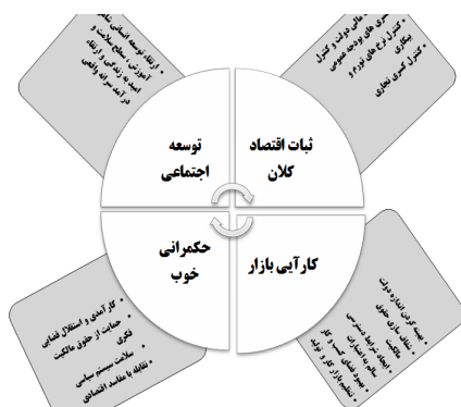
شکل ۲- شرایط لازم برای تاب‌آوری اقتصادی (بریگوگلیو، ۲۰۰۸: ۷)

متغیرهای اصلی تاب‌آوری اقتصادی عبارت‌اند از: اول، متغیرهای اقتصادی که توسط پایداری اقتصادی کلان و کارایی اقتصاد بررسی می‌شوند؛ دوم، متغیرهای اجتماعی - سیاسی که از سوی حکمرانی سیاسی خوب و توسعه اجتماعی مورد بررسی قرار می‌گیرند در شکل ۲ شرایط لازم برای تاب‌آوری اقتصاد و متغیرهای اصلی آن آمده است.