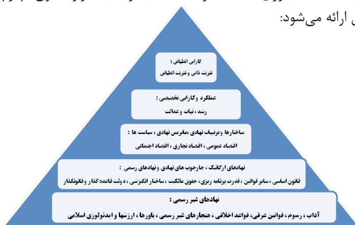
شکل ۳- چارچوب نظری برای طراحی الگوی کارایی اقتصاد مقاومتی جمهوری اسلامی ایران (منبع: تحقیق حاضر)

لذا حضرت امام خامنه‌ای نیز بر پیشرفت و عدالت، در مسیر رشد اقتصادی تأکید دارند و از طرفی، ثبات، رشد و عدالت از اصول اساسی اقتصاد در اصل سیزدهم قانون اساسی است. بنابراین، کارایی تخصیصی باید به سمت رشد، ثبات و عدالت، و کارایی انطباقی نیز به سمت تاب‌آوری اقتصاد حرکت کند. با توجه به موارد فوق، چارچوب نظری تحقیق ارائه می‌شود: